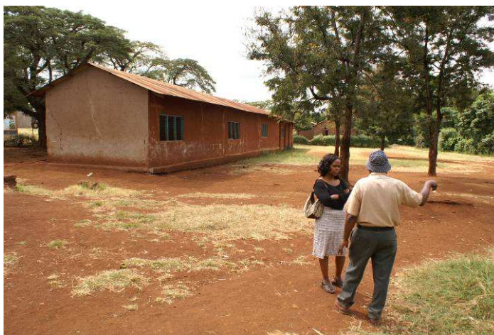
Les quatre classes condamnées pour dangerosité

(OU PLUS SI LE RECUEIL DE FONDS LE PERMET)