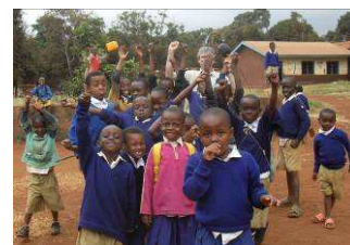
Enfants de l'école primaire de « Neville School »

« Lors de ce séjour, la rencontre avec les enfants a été riche humainement et a apporté l'énergie pour créer l'association et lancer des actions en faveur de leur éducation, ils ont soif d'apprendre... »